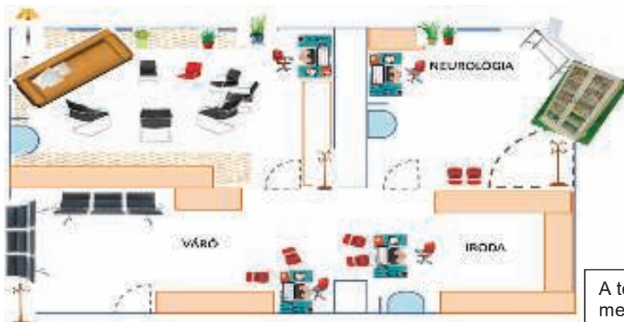
A terv és a megvalósulás

Legnagyobb problémánk a tartós orvosi, egészségügyi, rehabilitációs ellátást igénylő valamint értelmi fogyatékoságuk mellett pszichiátriai problémás ügyfeleink megfelelő szakgondozást nyújtó intézményben történő elhelyezése. Gyakorlatilag nincs megbízható hely, és az árak is kemények. Együttműködési szerződés keretében próbálunk állandó, megbízható, együttműködő partner-intézményre lelteni. Az is nagy feladat, hogy a hozzátartozókkal megértessük, hogy vannak állapotok, amiknek az ellátására nem vállalkozhatunk felelősen.