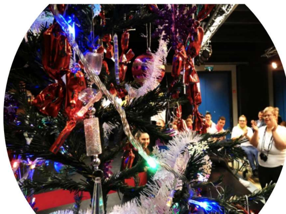
Az Angyalföldi Zenés Diákszínpad előadása