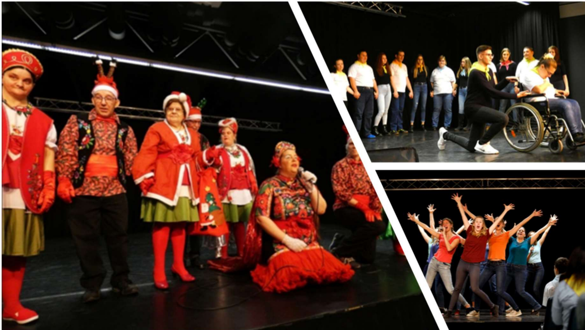
A Down Alapítvány produkciója

Az Egyedül Nem Megy Alapítvány produkciója