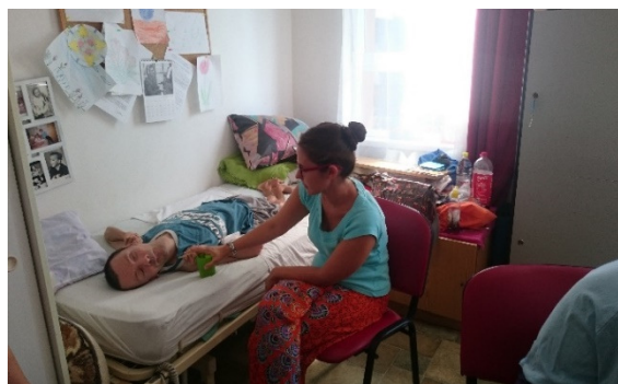
Gondozásban való segítség.

Önkéntességért felelős munkatársunk a Zágrábi otthonban: