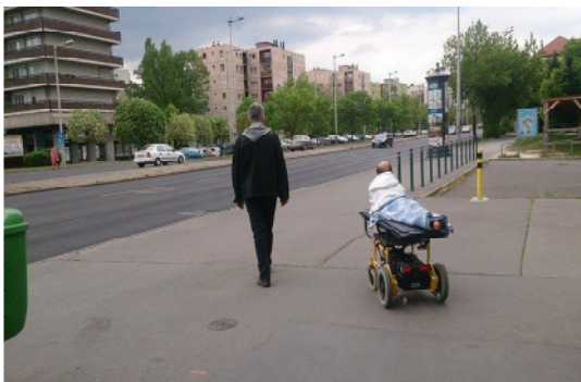
Az egyik legrégebbi önkéntesünk éppen a kísérésben segít.

https://www.facebook.com/downalapitvanygondozohaza?fref=ts