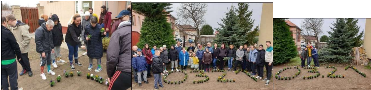
Világnap a Mária kertjében

Színes program, színes virág, színes zoknik – SZINTÉZIS. Mi már nyertünk!