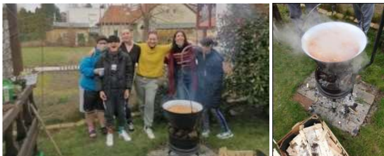
Bográcsban készül az ebéd