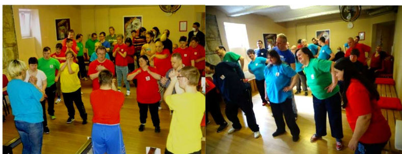
Egy kis bemelegítés a táncteremben