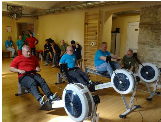
Ergométerverseny a Sportcentrumban