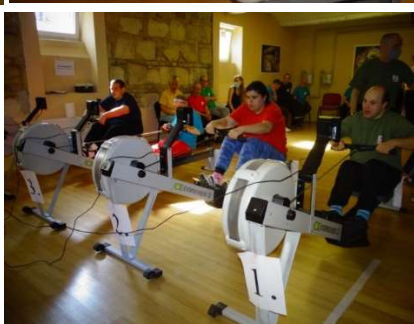
Ergométerezők és az eredménytábla