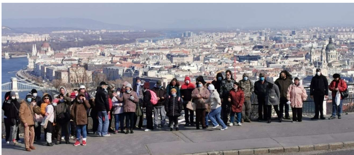
Mögöttünk a város