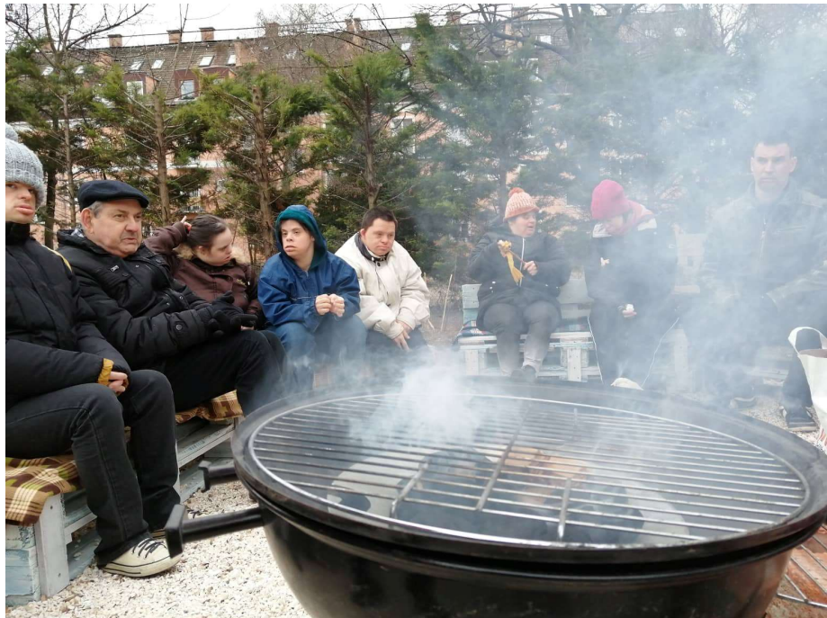
Kora tavaszi gardenparty a Szalókiban