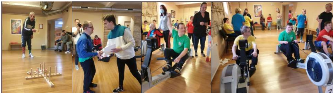
Sportoltunk, versenyeztünk, ünnepeltük a győzteseket