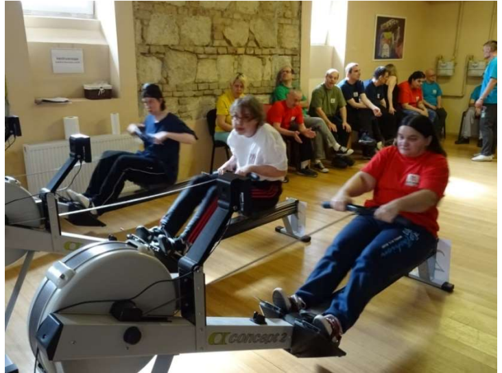
A somfások a Sportcentrumban rendezett háziversenyen