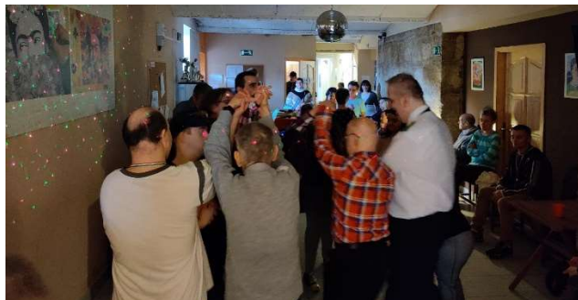
Az első táncos buli kereken egy év bezártság után: kizárólag oltottaknak