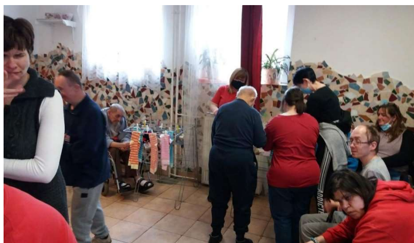
Zoknivalogatás és csipeszelés a Zágrábi játéknapján