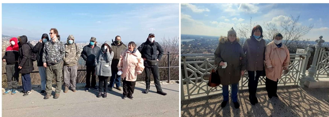
Találkozó a Gellért hegyen

A második alkalom egy sportnap volt a Bikás-parkban. A Somfa Otthon lakóival együtt mentünk el a Bikás-parkba kicsit mozogni, játszani. Asztaliteniszeztünk, bocsát játszottunk és voltak, akik kosárlabdáztak meg fociztak is. Vittünk magunkkal forró teát, így a csípős idő ellenére a mozgástól és a teától jól átmelegedtünk.