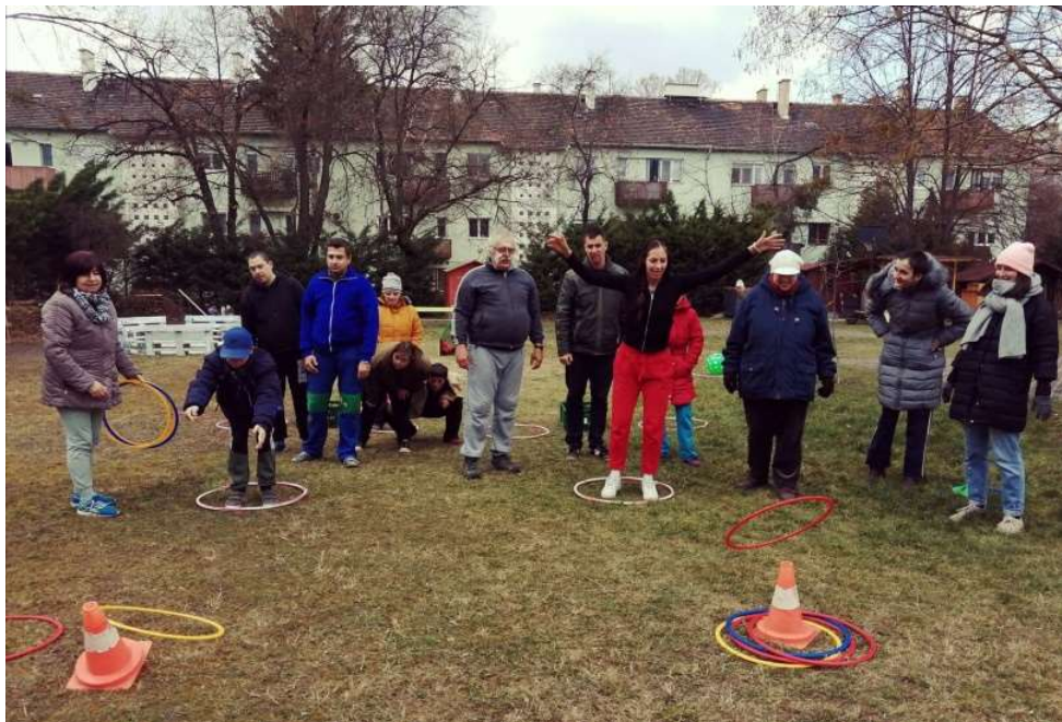
Exatlon a la Szalóki