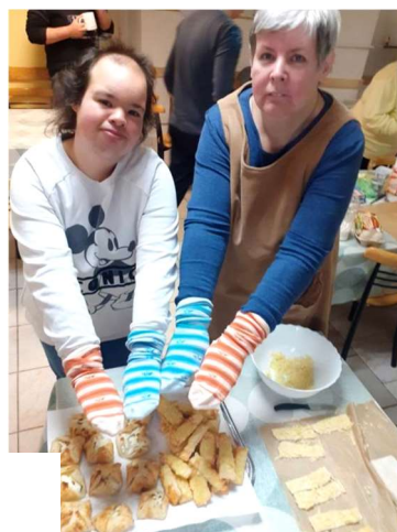
Süti-sütő verseny és fényképezkedés felemás zoknival