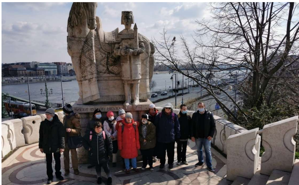
Mögöttünk Szent István a lóval