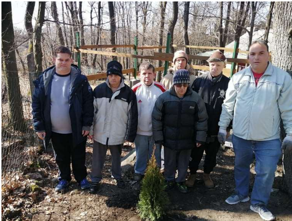
A csengerys csapat az emlékűl ültetett fácskával