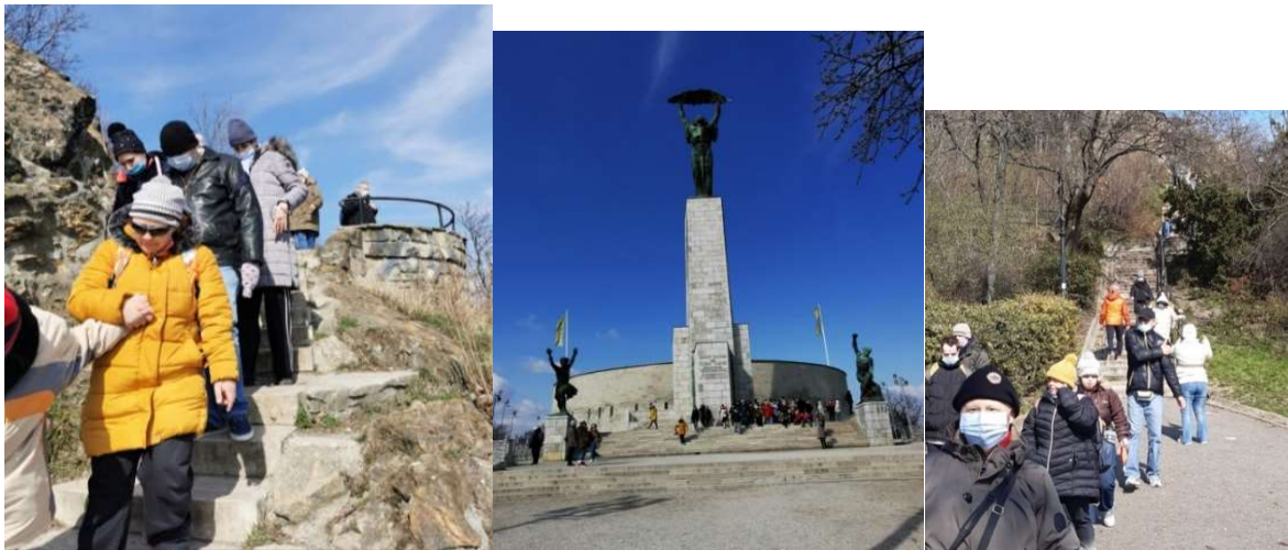
Kirándulók a Szalókiából, a Lágymányosiból és az Andor otthonból

Tíz szalóki lakó vágott neki a kalandos útnak, majd útközben találkoztak az Andor otthon lakóival, valamint a Lágymányosi csapattal. A cél a kívánságok alapján közös volt: hogy hosszú idő után láthassák ismét Budapestet a magasból, találkozhassanak rég nem látott barátokkal, friss levegőt szívhassanak és érezzék az összetartozás erejét.