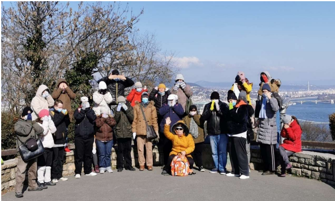
A Gellért-hegy tetején a kilátóponton

A közel egy éves bezártság után átütő élmény volt a srácok számára a környezet, a természet, a város látvány, a barátok, a szabadság.