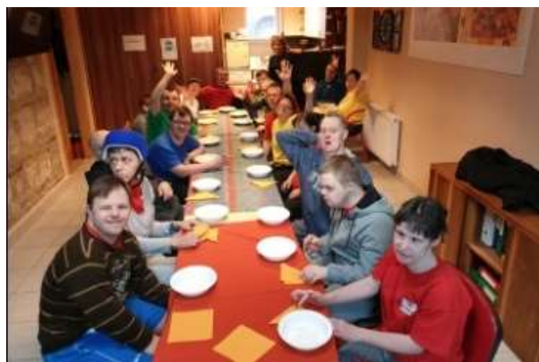
Közben megfőtt az ebéd, amit már nagyon éhesen várunk