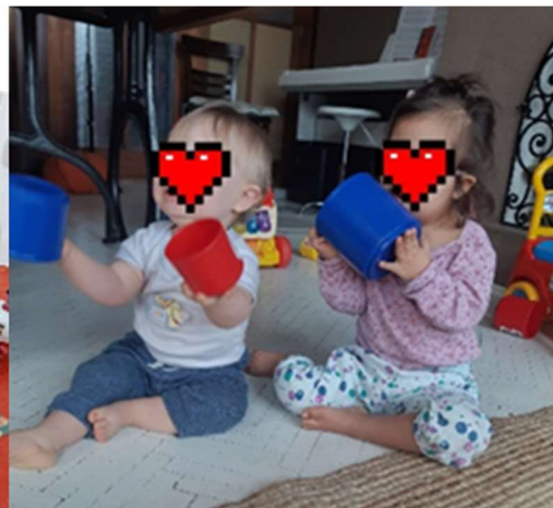
Online óra a Korai Fejlesztőben és a gyermek otthonában.