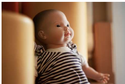
Down-szindrómás játékbaba | Fénykép: Németh Róbert

https://egy.hu/szocio/ha-elsore-ranel-down-szindromas-de-ha-jobban-megnezed-o-is-csak-egy-gyerek-111790