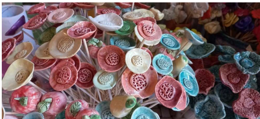
Termékeink és vásárolás

Segítséget keresünk a kézműves termékeink értékesítésében. Például kapcsolatot olyan cégekhez, melyek karácsonyra szeretnék megajándékozni kollégáikat a nálunk vásárolt termékekkel.