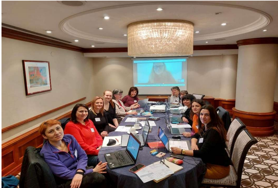
A ValueS Erasmus+ pályázat 2023. február 20-21-i nemzetközi találkozója Zágrábban